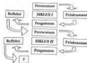
Gambar 1. Kerangka Berpikir

Prosedur penelitian tindakan kelas merupakan siklus dan dilaksanakan sesuai perencanaan tindakan atau perbaikan dari perencanaan tindakan terdahulu. Penelitian ini memerlukan evaluasi awal untuk mengetahui masalah dan menemukan solusinya. Tindakan kelas dilaksanakan dalam bentuk pembelajaran menggunakan media picture disertai dengan pendekatan, model, strategi, dan teknik. Dalam setiap tindakan peneliti dan kolaborator pengamat akan mengamati baik aktivitas maupun sikap peserta didik selama pembelajaran. Apabila dijabarkan dalam sebuah bagan maka akan didapati kerangka berpikir sebagai berikut: