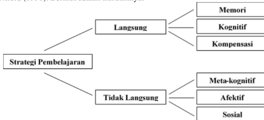
Gambar 1 . Strategi Pembelajaran Bahasa diadaptasi dari Oxford 1990

memahami suatu materi pembelajaran. Strategi pembelajaran tersebut masuk kedalam dua jenis pengelompokan yang berbeda, yaitu pembelajaran langsung ( direct learning ) dan pembelajaran tidak langsung ( indirect learning ). Untuk selanjutnya strategi langsung dikategorikan menjadi tiga bagian yaitu Memori, Kognitif dan kompensasi. Sedangkan pembelajaran tidak langsung dibagi juga kedalam tiga jenis berbeda yaitu meta-kognitif, afektif dan sosial. Pengelompokan strategi pembelajaran Bahasa ini mengikuti klasifikasi yaitu Oxford (1990). Berikut adalah ilustrasinya.