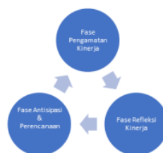
Gambar 1 Fase Regulasi Diri

Pengembangan regulasi diri siswa dalam proses pembelajaran tidak dapat terjadi begitu saja. Siswa tidak dapat dituntut untuk secara mandiri mengembangkan regulasi diri tanpa adanya intervensi dari guru. Di dalam pembelajaran, pengembangan regulasi diri dapat dimulai dari manipulasi lingkungan belajar. Beberapa dari strategi ini termasuk (1) instruksi dan pemodelan langsung, (2) praktik terbimbing dan mandiri, (3) dukungan dan umpan balik sosial, serta (4) praktik reflektif (Tonks & Taboada, 2011). Pengembangan regulasi diri pada umumnya terjadi selama beberapa Fase. Model pengembangan tersebut digambarkan dalam bentuk siklus terdiri dari tiga fase yaitu, (1) antisipasi dan perencanaan, (2) pengamatan kinerja, serta (3) refleksi kinerja (Pintrich & Zusho, 2002).