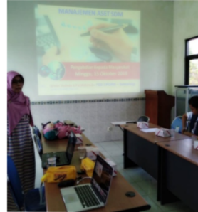
Gbr 2. Pengabdian memberikan Materi

Pada sesi pertama pengurus masjid diajarkan proses pengelolaan manajemen aset sumber daya manusia dengan menjelaskan proses pengelolaan sumber daya manusia yang dimiliki oleh masjid. Aset sumber daya manusia yang dimiliki menyangkut kualitas SDM, jumlah SDM, beban kerja, keunggulan dan kelemahan yang dimiliki oleh pengurus Masjid Al-Ikhlas. Pada saat pengelolaan tersebut pelatih mengajarkan proses untuk menganalisis model pengembangan aset sumber daya manusia dengan menggunakan model Likert dan Ogan terhadap semua pengurus masjid Al-Ikhlas. Hal tersebut dimaksudkan agar mereka dapat mengidentifikasi secara tepat dan benar apa saja yang harus diperbaiki dan dibenahi dalam pelaksanaan program kerja.