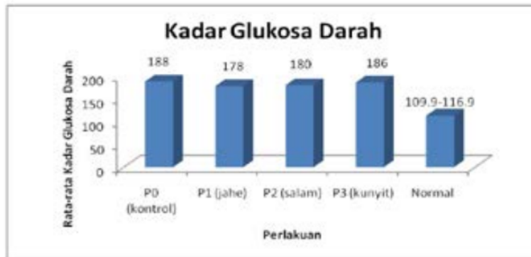
Gambar 2. Histogram Pengaruh Pemberian Tambahan Herbal Jahe, Kunyit dan Salam Terhadap Kadar Glukosa Darah pada Bebek.

yang paling tinggi. Tingginya kadar asam urat pada perlakuan ini disebabkan oleh berbagai faktor salah satunya adalah stress. Asam urat merupakan salah satu gangguan yang terkait dengan kerusakan ginjal pada burung. Penyebab asam urat adalah banyaknya kerusakan ginjal terjadi karena faktor multi-etologi yang secara luas dikategorikan sebagai Penyebab nutrisi dan metabolik, penyebab infeksi dan penyebab lainnya seperti mikotoksin (Eldaghayes et al. , 2010). Pada saat tubuh (ginjal) gagal memetabolisme protein tinggi dan asupan purin dengan benar hal tersebut yang menyebabkan terjadinya peningkatan asam urat dalam darah (Milind et al. , 2013).