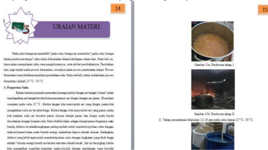
Gambar 1 . Contoh isi modul sains berbasis local wisdom tempe pada pokok bahasan suhu dan kalor di MTs

Modul Sains berbasis local wisdom tempe pada pokok bahasan suhu dan kalor di MTs yang telah dikembangkan ini merupakan modul yang terintegrasi dengan local wisdom tempe daerah banyumeneng sehingga dalam perancangan isi modul dibuat bermuansa local wisdom tempe. Analisis materi telah dilakukan dengan mengidentifikasi kompetensi inti dan kompetensi dasar mata pelajaran IPA/Sains, berdasarkan indentifikasi yang telah dilakukan maka didapatkan materi yang dimasukkan dalam modul pembelajaran dan disusun secara sistematis untuk disajikan pada modul pembelajaran kearifan lokal tempe. Konsep sains yang terdapat pada pokok bahasan suhu dan kalor juga dirancang selaras dengan local wisdom tempe di daerah Banyumeneng, seperti halnya perebusan kacang kedelai dan proses peragian. Berikut contoh modul IPA yang dikembangkan dapat dilihat Gambar 1.