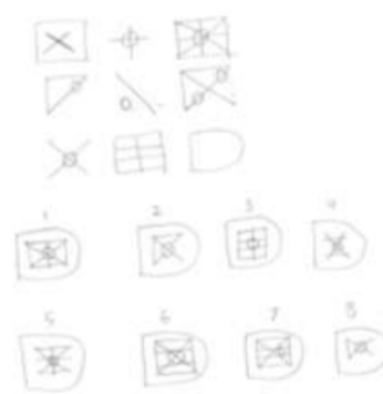
Gambar 2. Soal Raven Test yang dibuat

Responden dapat membuat contoh atau pernyataan soal raven test yang bersifat baru dan strategi penyelesaiannya juga berbeda dari yang biasanya. Ini dapat ditunjukkan saat responden diminta membuat contoh tentang soal raven test yang sejenis dengan soal raven test yang ada. Ini menunjukkan kebaruan responden dalam membuat contoh soal raven test beserta strategi penyelesaiannya. Selain itu, kebaruan juga terlihat pada jawaban tentang proses analisis yang dilakukan oleh masing-masing responden.