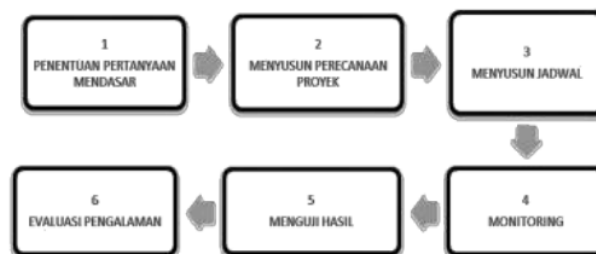
Bagan 2.1 Langkah-langkah Operasional

Langkah-langkah pelaksanaan pembelajaran berbasis proyek dapat dijelaskan dengan bagan sebagai berikut.